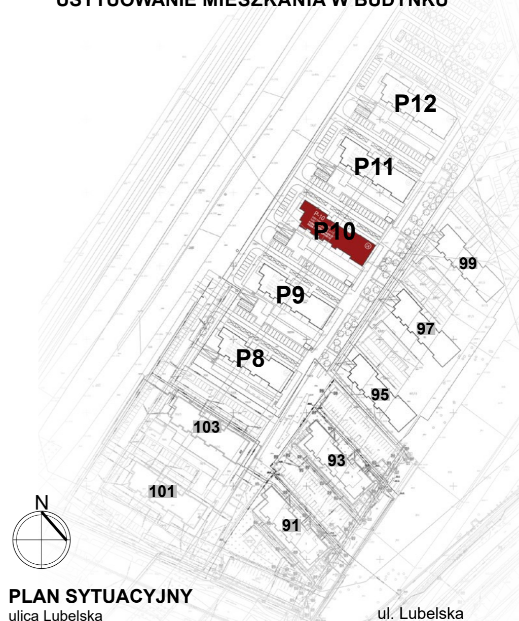
PLAN SYTUACYJNY ulica Lubelska