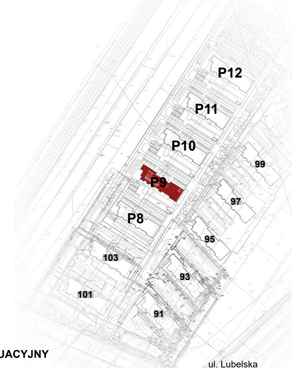
PLAN SYTUACYJNY ulica Lubelska