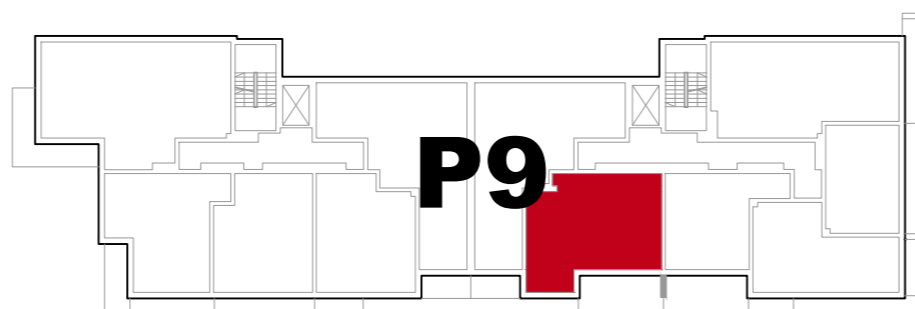
USYTUOWANIE MIESZKANIA W BUDYNKU

OPRACOWANY NA PODSTAWIE PROJEKTU BUDOWLANEGO, A PRZEDSTAWIONA ARANŻACJA JEST PRZYKŁADOWA. POWIERZCHNIE MOGĄ ULEC ZMIANIE NA ETAPIE REALIZACJI. WYMIARY PODANO W STANIE SUROWYM BEZ UWZGLĘDNIANIA TYNKÓW.