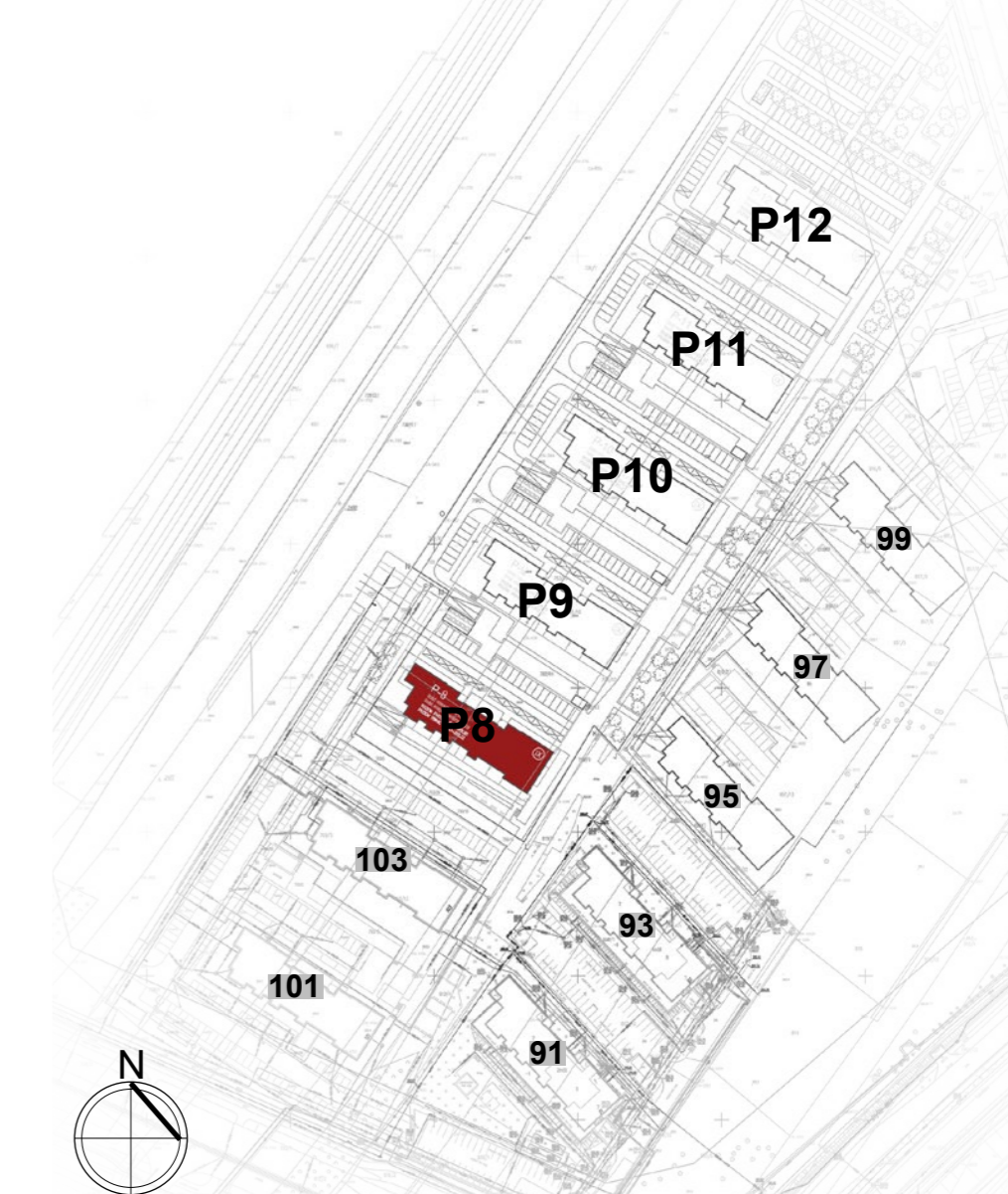
PLAN SYTUACYJNY ulica Lubelska