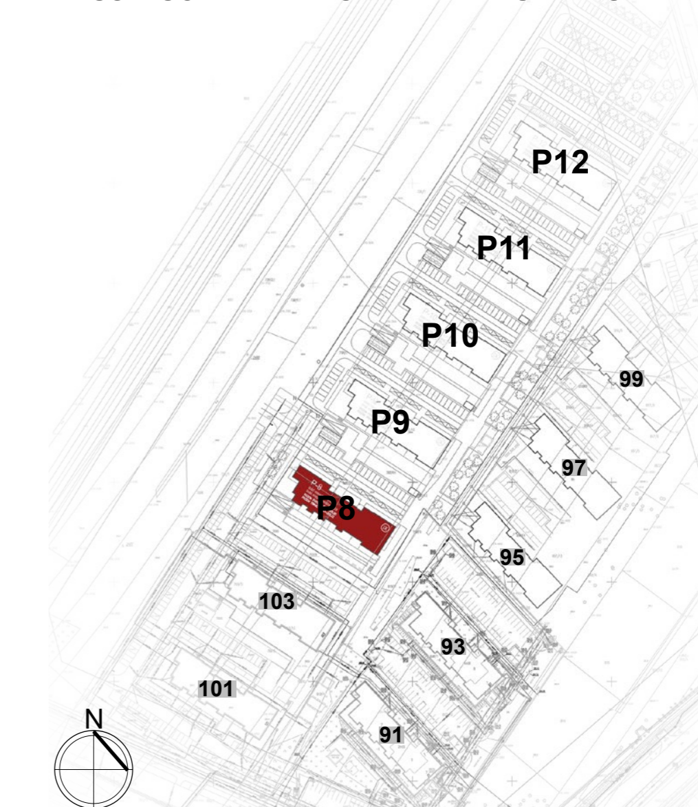
PLAN SYTUACYJNY ulica Lubelska