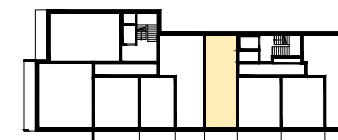
RZUT KONDYGNACJI Z LOKALIZACJĄ MIESZKANIA