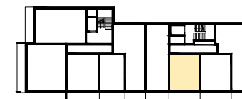
RZUT KONDYGNACJI Z LOKALIZACJĄ MIESZKANIA