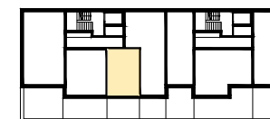
RZUT KONDYGNACJI Z LOKALIZACJĄ MIESZKANIA