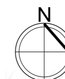
PLAN SYTUACYJNY Rejon ulicy Lubelskiej