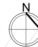
PLAN SYTUACYJNY Rejon ulicy Lubelskiej