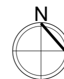
PLAN SYTUACYJNY Rejon ulicy Lubelskiej