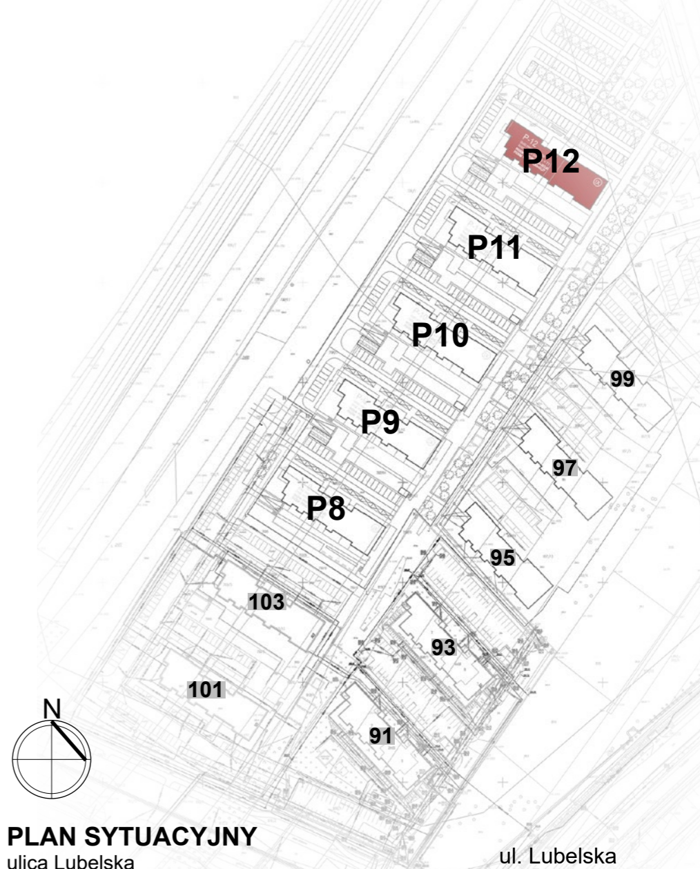
PLAN SYTUACYJNY ulica Lubelska